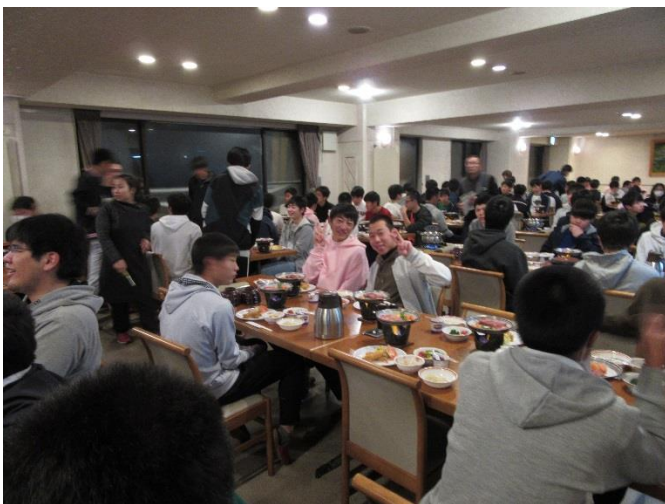
夜の班別ミーティング

天候には恵まれませんでしたが、みんな頑張ったのでスキーが上手になりました。達成感とスキーの楽しさを味わった修学旅行となりました。